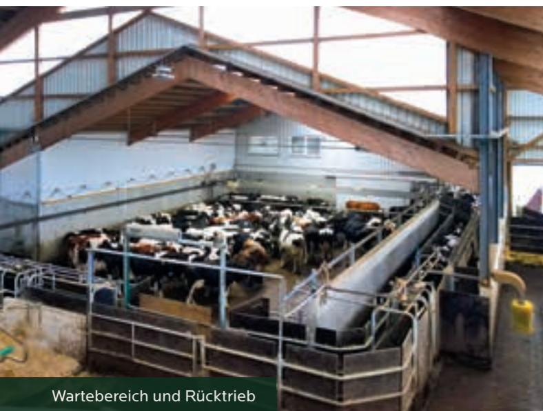
Wartebereich und Rücktrieb