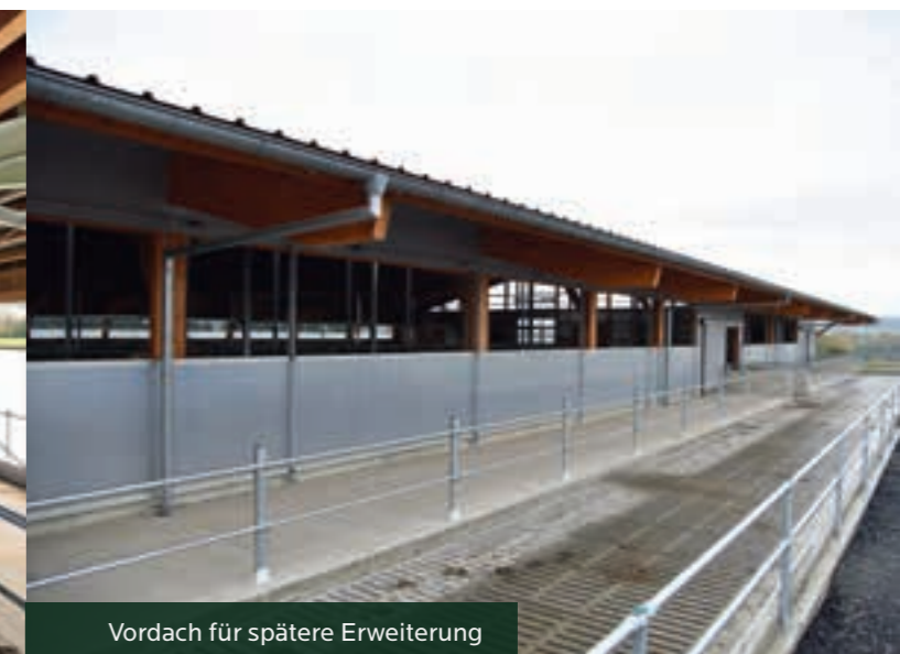
Vordach für spätere Erweiterung