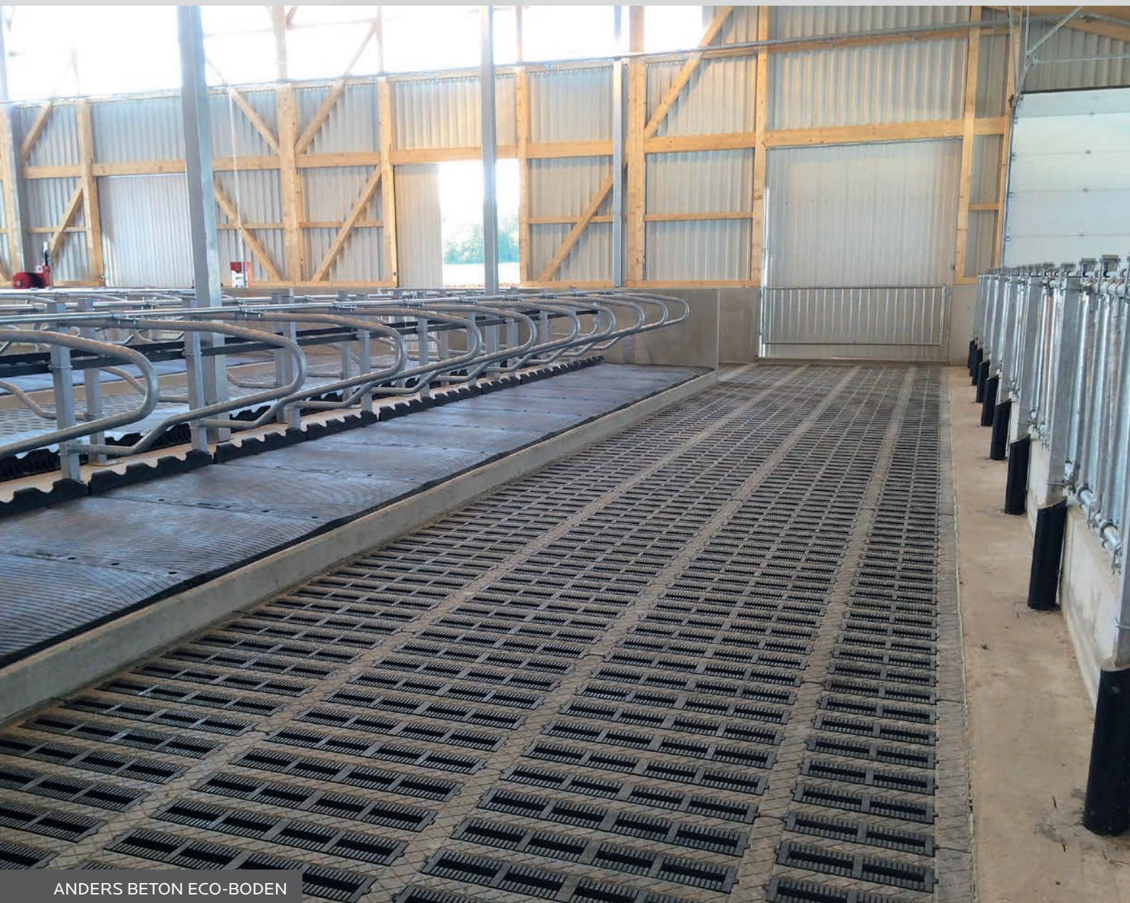
ANDERS BETON ECO-BODEN